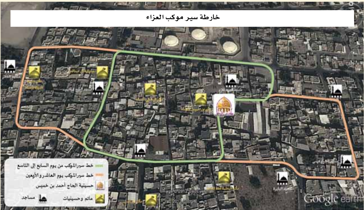
خارطة سير موكب العزاء

وعليه ندعو بقلوب متلهفة وصادقة ومع قرب هذه المناسبة إلى شحذ همم الجميع صغاراً وكباراً ونساءً ورجالاً باختلاف اهتماماتهم واختصاصاتهم للتجديد والابداع لنجعل من قضية الإمام الحسين (ع) ماثلة أمامنا نستحضرها ونتفاعل معها ونتأثر بها وتدفعنا لتغيير الواقع السيء المحيط بنا.