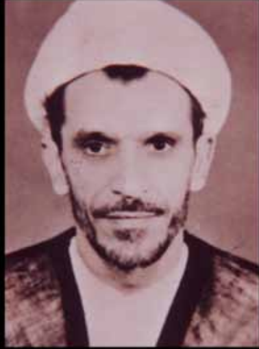
الشيخ عبدالوهاب الكاشي