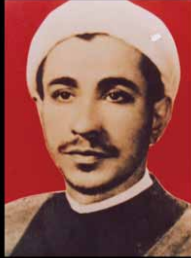
الشيخ باقر المقدسي